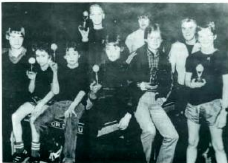
Finalisten scholierentoernooi 1980

Het idee om hieraan deel te nemen ontstond toen bij het 25 jarig jubileum een toernooi voor de scholieren werd gehouden, dat enorm aansloeg.